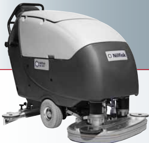
Nilfisk BA 851

Inoltre tutte le macchine sono ora equipaggiate con il nuovo sistema Ecoflex che consente di mantenere un controllo completo dei consumi attraverso la possibilità di incrementare temporaneamente il flusso dell'acqua, del detergente (per le macchine allestite con l'Ecoflex Chemical Kit) e la pressione sulle spazzole nei casi in cui sia richiesta una maggiore forza lavante.