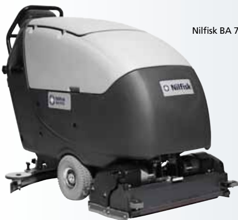
Nilfisk BA 751C

Tutte le funzioni sono attivabili direttamente dal pannello di controllo, riducendo i rischi di errore, per i migliori risultati di pulizia