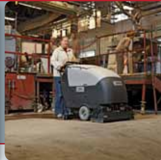
La serie BA651/751/851 è concepita per la pulizia di ampie aree quali supermercati, ospedali e industrie